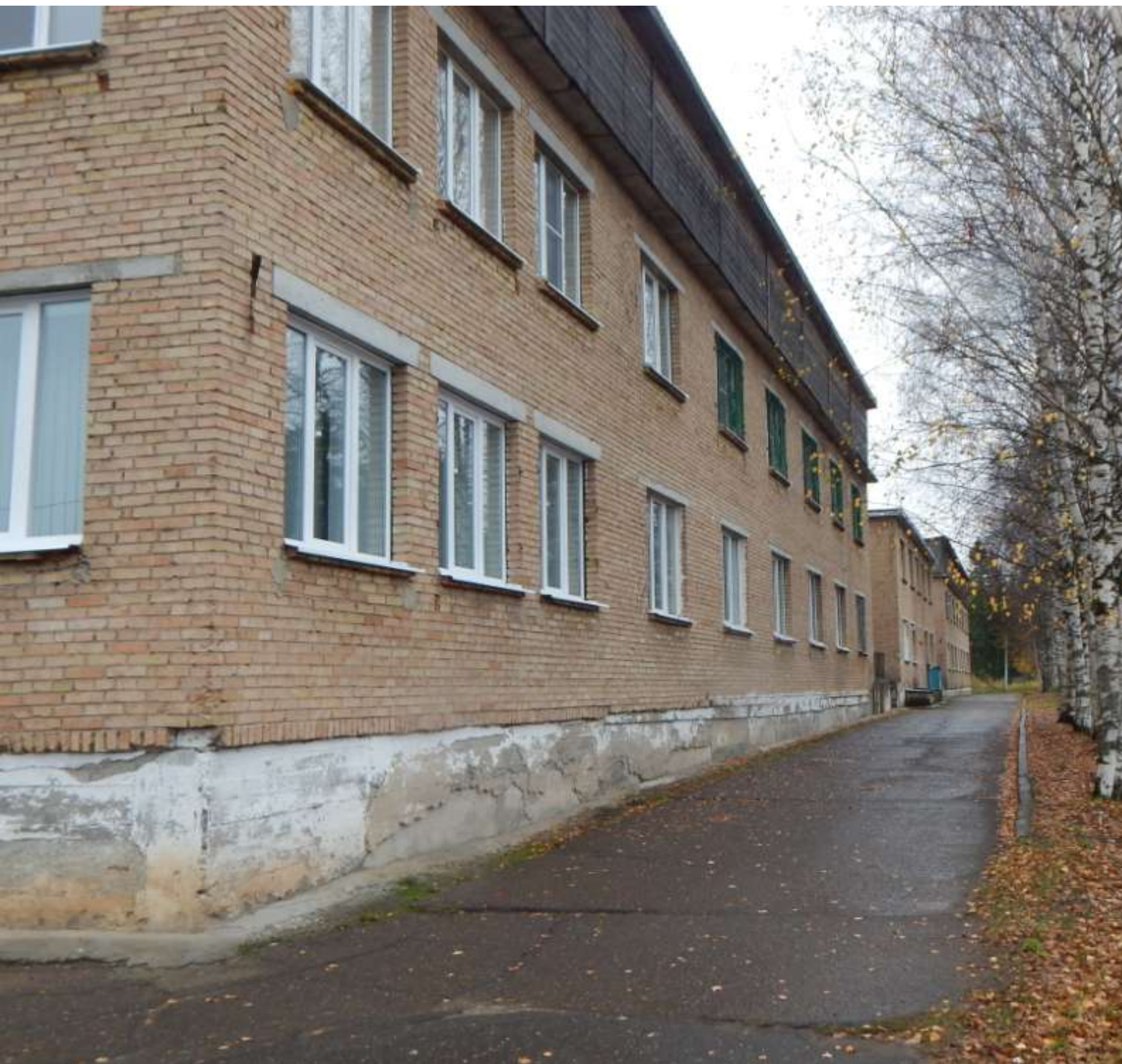
Фото лечебного корпуса отделения № 1 и № 6.