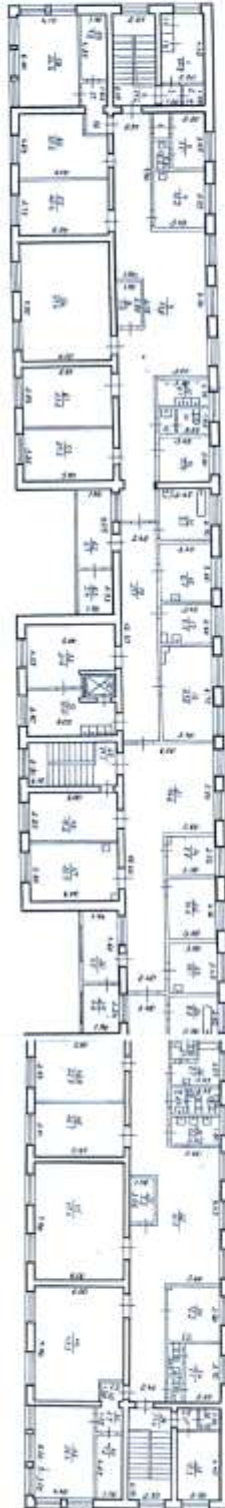
ГУ КРПБ отделение № 1 2-й этаж